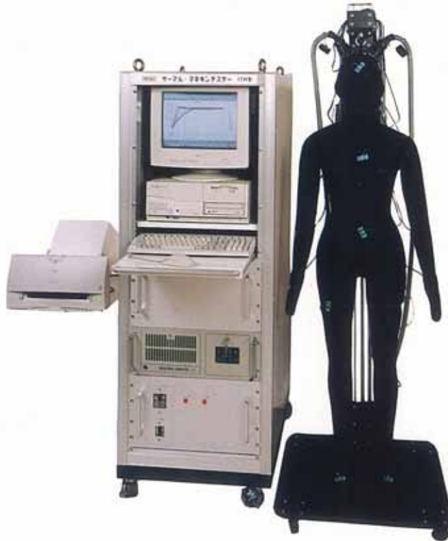
データ処理装置：Windows対応方式

現代の衣服に要求されるものは、単なるファッション性だけでは無く用途にあった快適性を重視する傾向があります。つまり、周辺の気温に拘らず、身体の周囲に快適な温熱条件を作るという衣服の重要な役目は、衣服の保温性に依るものであり、その保温性は、繊維や布の熱伝導率、含気性、通気性等で決定されますが、総合的にはその中に含まれている動かない空気の量で決まるといって良いでしょう。又、それを測定する事に依り、快適性の評価特性に基づく高度多機能繊維の加工技術の研究開発やファッション性と快適性の関係に貢献すると考えます。