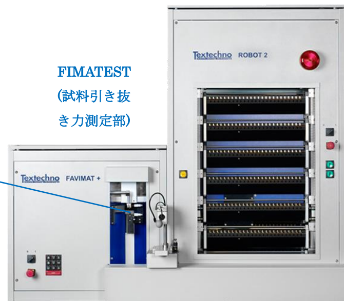
FIMATEST (試料引き抜き力測定部)